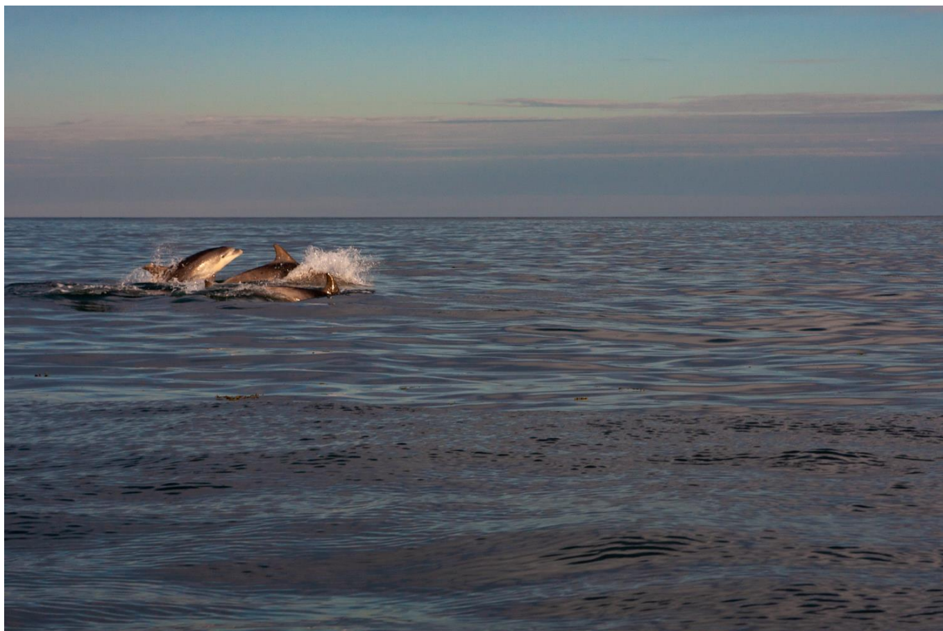
Groupe de Grand dauphin

Dîner sur le voilier et mouillage près d'Aurigny.