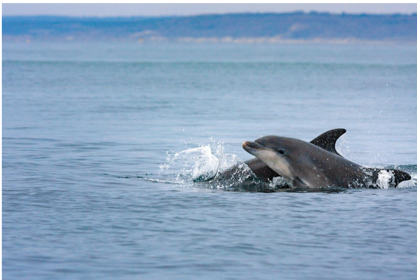
Gruppe de grand dauphin ( Tursiops truncatus )

Vous y êtes, le dernier jour de votre croisière scientifique à la voile. Vous parcourez les derniers miles nautiques qui vous séparent de Granville. Arrivé au port vous échangez vos adresses e-mails puis le groupe se disperse.