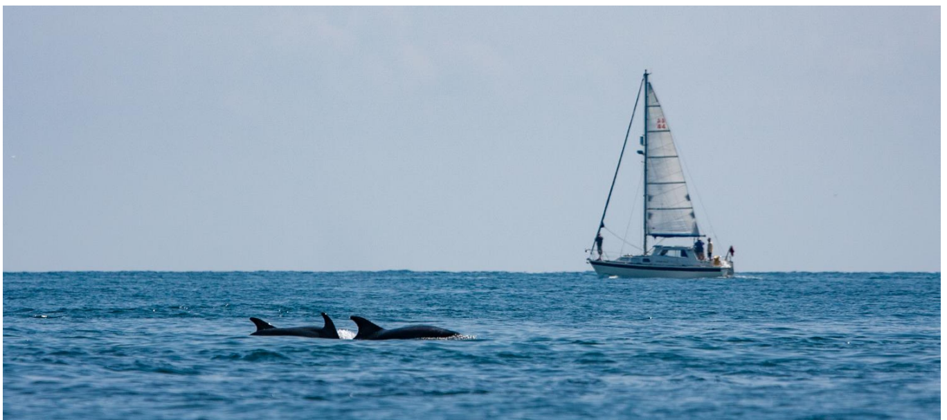
Groupe de Grand dauphin à proximité d'un voilier

Le Golfe Normand Breton est donc une région propice aux observations naturalistes . Durant votre navigation vous aurez l'occasion d'observer et d'étudier des mammifères marins et des oiseaux marins . Ce séjour a pour but la découverte par la science ! Et lors de ce séjour, VOUS participez activement à cette science ! Alors embarquez pour l'étude des grands prédateurs de la côte ouest du Cotentin. Voyagez utile, voyagez éthique, voyagez écolo !