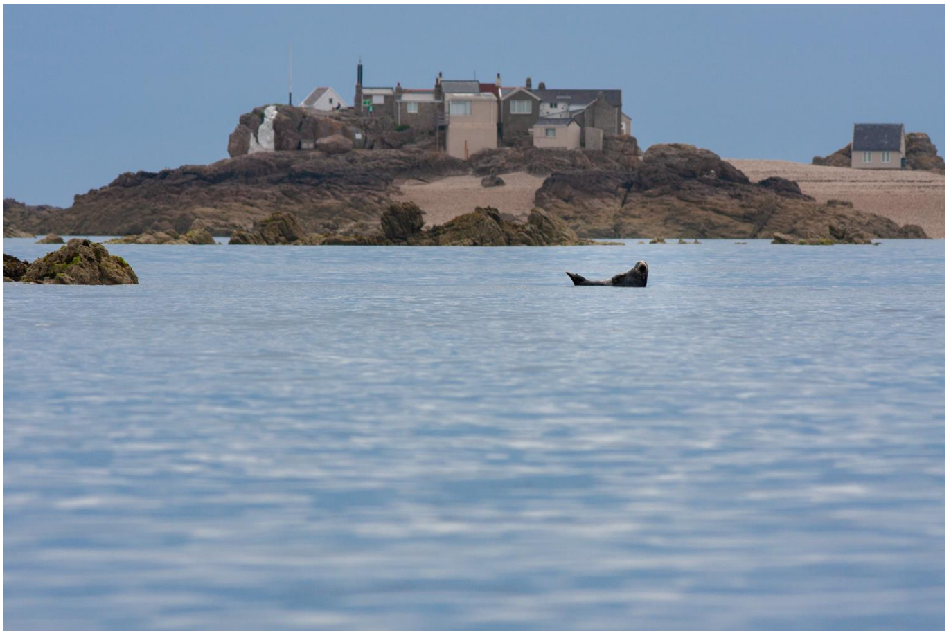
Phoque gris au repos – Archipel des Ecréhous

Si l'avancée de votre navigation vous le permet, vous ferez une halte et un dernier mouillage dans l'archipel de Chausey .