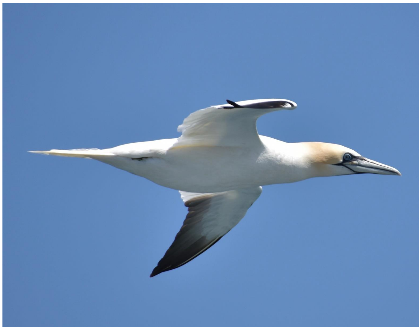
Fou de Bassan en vol

Retour sur le voilier pour dîner au mouillage.