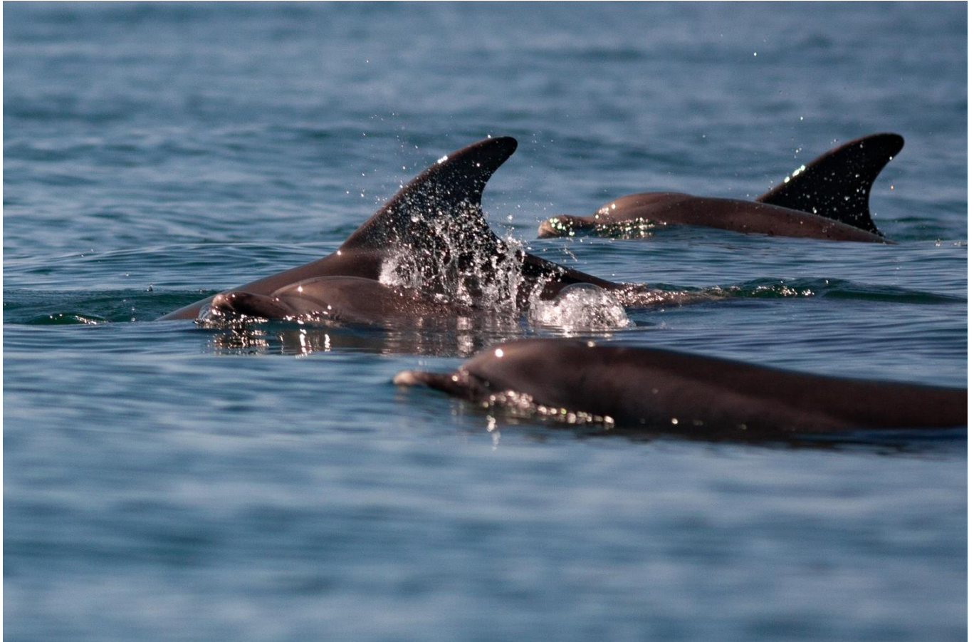
Grand dauphin ( Tursiops truncatus )

Le Golfe Normand Breton s'étend, comme son nom l'indique, de la Bretagne à la Normandie. Il englobe les côtes du Cotentin , mais aussi les îles anglo-normandes . Le Golfe Normand Breton c'est donc l'occasion de voir dans les eaux françaises, un peu de l'Angleterre !