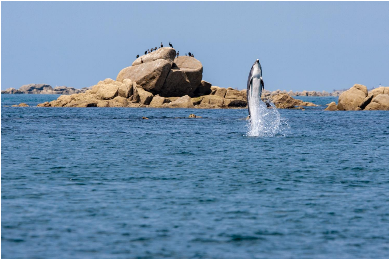
Saut d'un Grand dauphin devant un îlot du plateau des Minquiers

Vous naviguez ensuite jusque l'île Anglo Normande de Jersey où vous vous installerez au mouillage. Repas et nuit sur le voilier.