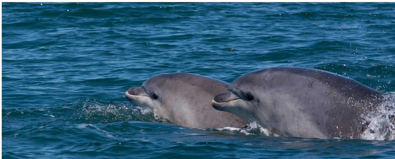
Grand dauphin ( Tursiops truncatus )

Il n'est pas impossible, même si les chances sont très minces, d'observer le Cachalot ( Physeter macrocephalus ), le Dauphin bleu et blanc ( Stenella coeruleoalba ), le Lagénorhynque à flancs blancs ( Lagenorhynchus acutus ) et à bec blanc ( Lagenorhynchus albirostris ), l'Orque ( Orcinus orca ), le Mésoplodon de Sowerby ( Mesoplodon bidens ) et l'Hyperoodon boréal ( Hyperoodon ampullatus ).