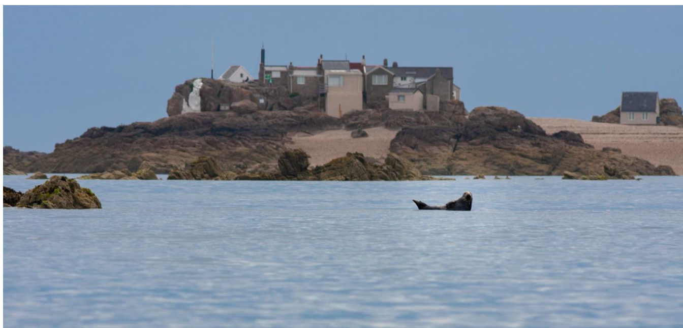
Phoque gris se reposant aux Ecréhous

Des pinnipèdes : le phoque veau-marin ( Phoca vitulina ) (2 colonies reproductrices) est très régulièrement observé dans le Golfe Normand Breton où il est connu pour s'y reproduire. Le phoque gris ( Halichoerus grypus ) est lui aussi régulièrement observé, et certains groupes semblent s'être sédentarisés aux Ecréhous et aux Minquiers.