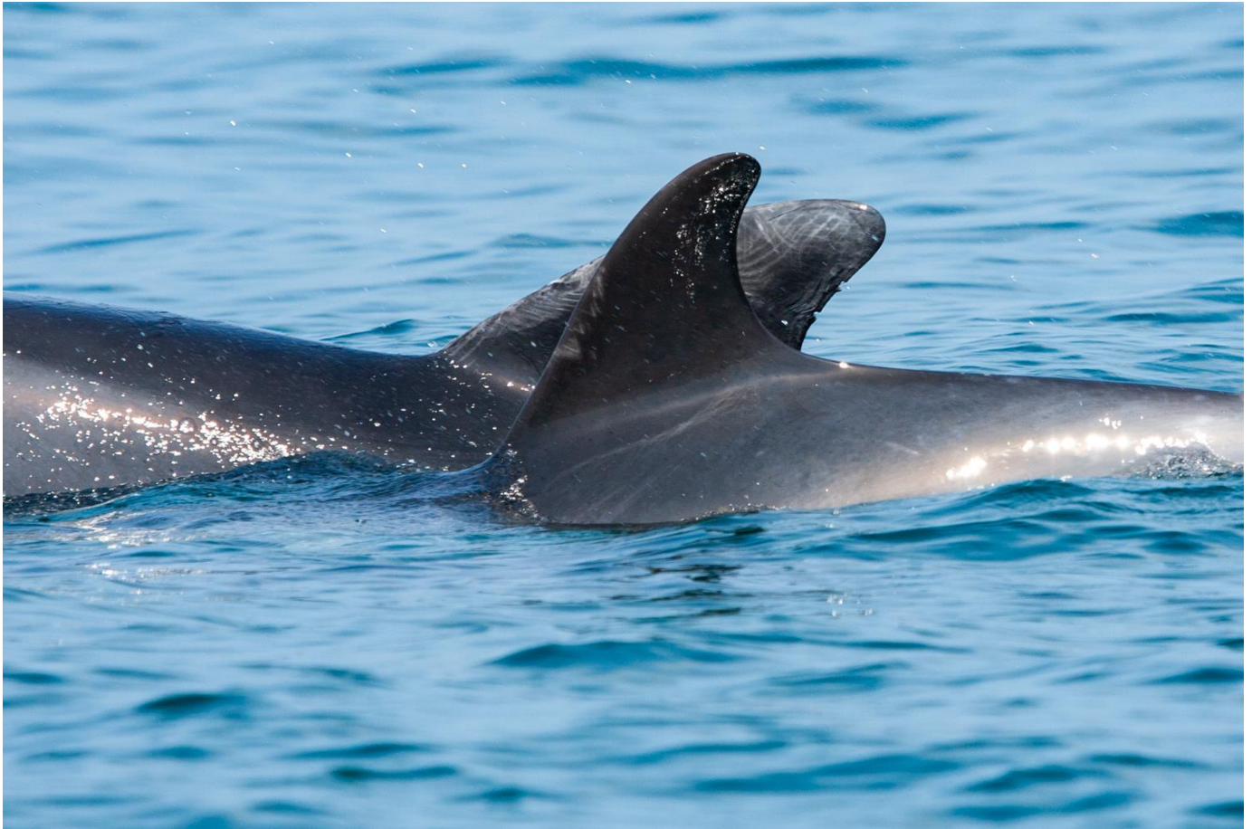
Photo identification de la dorsale de grand dauphin ( Tursiops truncatus )